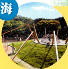
清水區鰲峰山公園