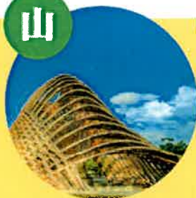
豐原區葫蘆墩公園