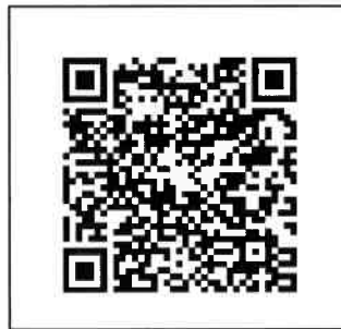
團體報名表單下載