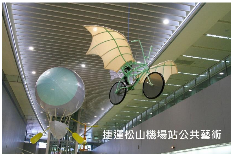
捷運松山機場站公共藝術