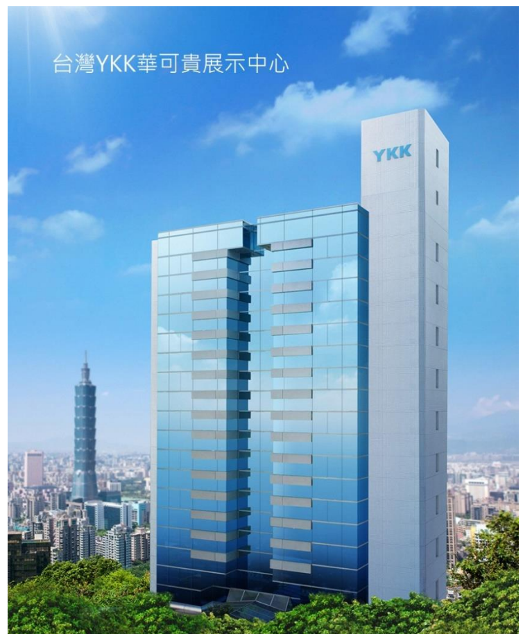
台灣YKK華可貴展示中心